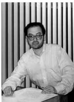
CORTÉS, RENÁN (1958)

Esta obra obtuvo el Premio Altazor 2005 e inauguró los carnavales culturales de ese año del Consejo Nacional de la Cultura y las Artes en la Plaza Sotomayor de Valparaíso. Se ha estrenado en varios países incluyendo Polonia, Perú, Argentina, Uruguay, etc., y se ha interpretado en más de cuarenta conciertos por el Coro Karpatia de la Escuela Universitaria de Música de Montevideo”.