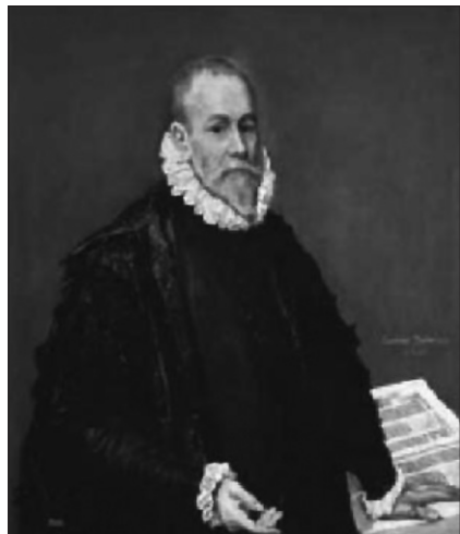
Figura 1. Retrato de Luis Mercado por El Greco. Museo del Prado.

Volviendo a Mercado, (Figura 1) nació y estudió en Valladolid, donde llegó a ser profesor. Fue médico de los reyes Felipe II y III. Por su indiscutido prestigio, Felipe II le encomendó que redactara los conocimientos y las normas que debían regir los exámenes de los médicos y cirujanos ante el tribunal del Protomedicato, el que publicó en 1594 con el nombre de “ Institutiones Medicae ” (Figura 2). Mercado pasó a la historia de la medicina por la recopilación de todos los conocimientos médicos existentes, desde sus fuentes griegas, latinas y árabes, publicados en su Opera omnia , obra que fue re-editada en múltiples ocasiones, incluso después de su muerte. Sus cuatro volúmenes responden a un programa cuidadosamente planificado. El primero, aparte de cuestiones generales de carácter conceptual y metodológico, se ocupa de anatomía y fisiología, higiene y patología general. El segundo