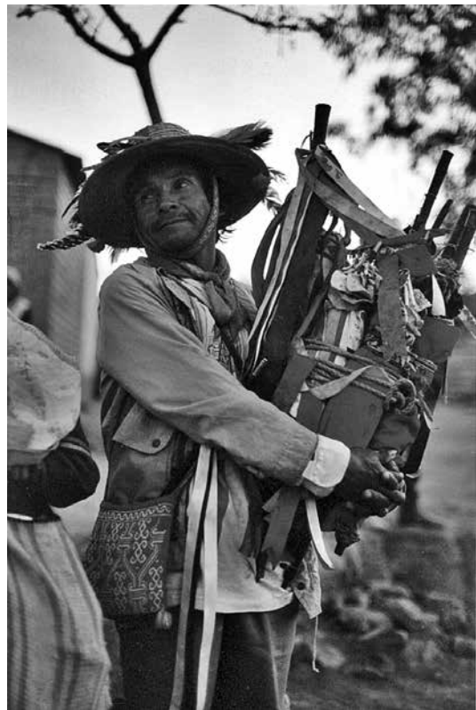
Foto 3. Funcionario portando las varas de mando durante el cambio de varas del 2001.

A la par de las autoridades civiles de la comunidad, se encuentran las autoridades religiosas, que se ocupan de los asuntos referentes al culto de los santos en sus respectivas capillas y que se ligan a los funcionarios