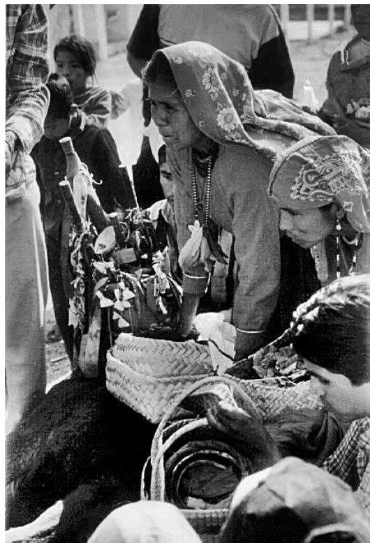
Foto 2. Funcionarios de la jerarquía cívico-religiosa portan las varas de mando y las reliquias de los santos durante la celebración de la Semana Santa de 2001.

En realidad, las mujeres juegan un papel de gran importancia en cualquiera de las jerarquías tradicionales, ya sea en el recinto Tukipa , la Katsarianal Casa de gobierno o las capillas (Imagen 2). En cualquiera de las jerarquías asociadas a estos recintos es un requisito indispensable que todo funcionario tenga una compañera que comparte el prestigio, las obligaciones y el respeto que acompaña al cargo de su esposo (Weigand, 1992) 26 . Por ello, las mujeres de los funcionarios principales tienen mando sobre las esposas de sus respectivos topiles, que les ayudan