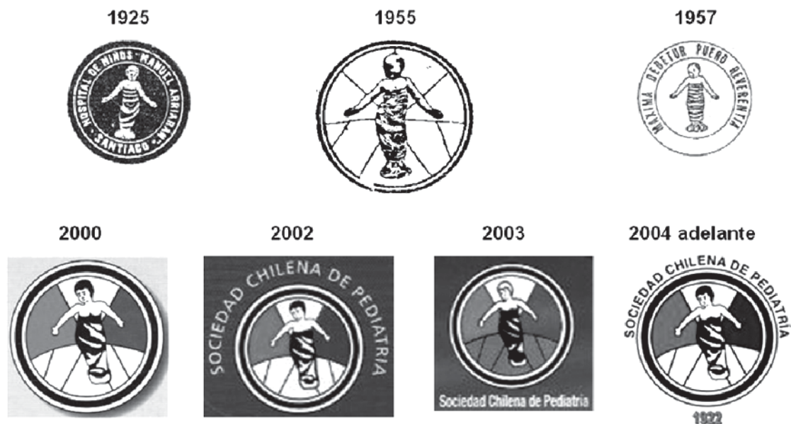
Figura 4. Variantes del logo y logo actual.

"...quienes son comúnmente llamados expósitos... cuyos padres y madres, contra la ley y la naturaleza humana, los han abandonado" 10 . Filippo di Ser Brunelleschi Lippi, conocido como Brunellesco, (1377 - 15 de Abril 1446) miembro de este patronato desde 1404, hizo el diseño y dirigió personalmente la obra como "capomaestro" hasta 1427, abandonando el esquema del antiguo hospital medioeval dando origen a un nuevo modelo, el que se transformó en el ejemplo de la construcción renacentista. Posterior a 1427, Francesco della Luna se hace cargo de las obras, a quien se ha atribuido el