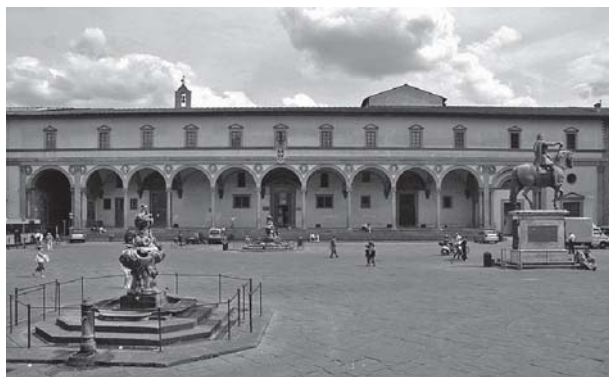
Figura 5. Hospital de los Inocentes.

En el pórtico, a base de arcos, se refleja el sistema de proporciones en que se basa la arquitectura brunellesquiana , pues el ancho del vano y del pórtico es igual al alto de las columnas, con lo cual se forma un cubo que se repite nueve veces 9 , ofreciendo una amplia comunicación al exterior y la plaza. Esta disposición lo diferencia de los "ospedali", la visión medioeval del hospital, más cercano a los monasterios, cerrados, con escasa circulación de gente, en contraposición con esta característica de apertura más cercana a la concepción actual del hospital, con una amplia comunicación al exterior a través de los arcos del pórtico o "loggia",