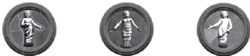
Figura 6. Tondos o Rodelas de terracota representando al Bambino expósito.

Las teorías sobre el diseño mismo que Andrea realizó para la confección de los “bambini”, sus motivaciones y la simbología que proyecta son parte de la historia desconocida de esa época; sin embargo, se puede destacar el aspecto angelical de las formas, el aparente buen estado nutricional que destacan y el gesto amable en la mirada junto al de solicitud expresada en sus brazos. Se puede especular que representan a Jesús-niño, expresando gestos de confianza en quienes lo están acogiendo y protegiendo, pero a la vez de solicitud de apoyo ante el abandono. Las libertades creativas de Della Robbia se observan también en el vestuario; los ropajes que cubren al niño son el reflejo de la moda de la época que, con distintos argumentos, se usaba envolver a los menores