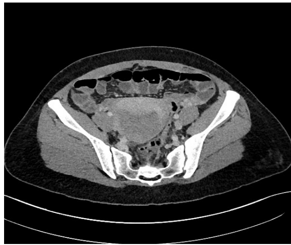
Figura 1. TAC pelvis en fase venosa en que se descarta trombosis de vena ovárica