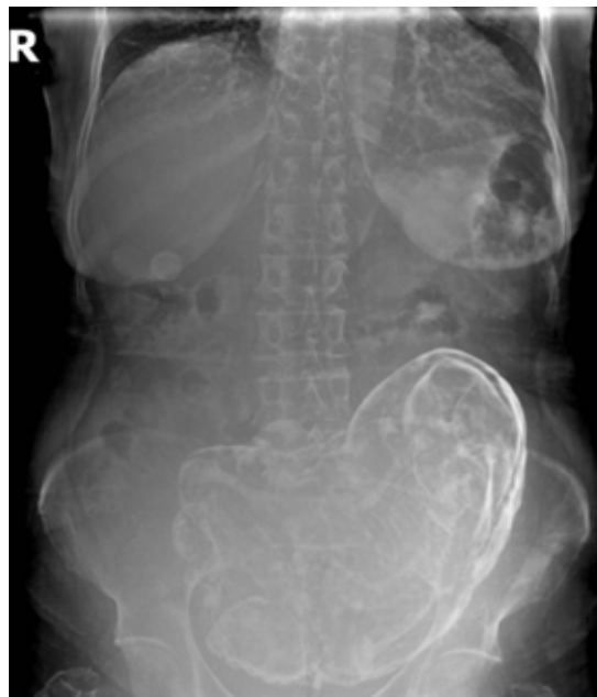
Figura 1. Radiografía que muestra feto y las membranas del saco amniótico calcificadas en posición longitudinal y presentación pélvica.

Se realizaron radiografías del abdomen (Figura 1), ultrasonografía y tomografía computarizada (Figura 2, 3, 4 y 5), que evidenciaron la presencia de feto intraabdominal calcificado.