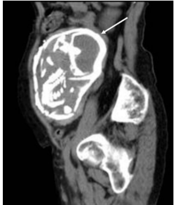
Figura 4. Tomografía computarizada, corte sagital, ventana de partes flexibles. Presencia de saco gestacional intraabdominal de paredes calcificadas (flecha blanca) cuyo feto se encuentra en situación longitudinal y presentación pélvica con edad gestacional estimada en 29-30 semanas.