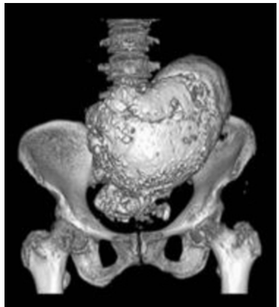
Figura 5. Tomografía computarizada con reconstrucción en 3D. Visualización del feto en situación longitudinal y presentación pélvica en la cavidad abdominal.