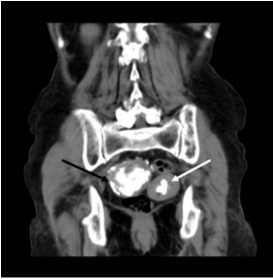
Figura 2. Tomografía computarizada, corte coronal, ventana de partes flexibles, evidenciando la presencia de imágenes calcificadas groseras, siendo una intrauterina (flecha blanca) y otra parauterina a la derecha (flecha negra).