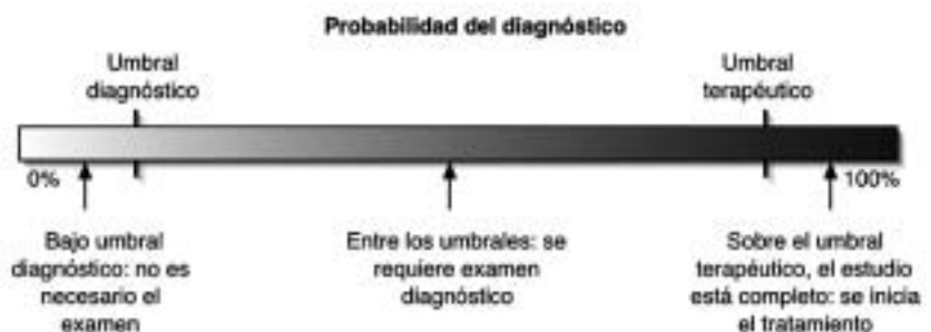
Figura 1. Umbrales para realizar un examen diagnóstico de acuerdo a la probabilidad del diagnóstico clínico.

La búsqueda de información relevante en PubMed ( http://www.pubmed.gov ) utilizando los