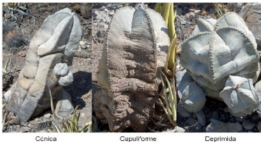
Fig. 2: Morfotipos de Astrophytum myriostigma presentes en el área de estudio.

La comparación de las medias de los perímetros de los morfotipos mostró una