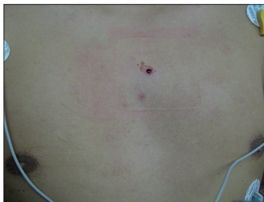
Figura 1. Herida en región medioesternal, correspondiente a la entrada del proyectil.

ria de 16 y temperatura axilar de 36° C. Presenta una lesión de 0,5 cm de diámetro redondeada, sin sangrado activo, a nivel del segundo espacio intercostal línea medioesternal (Figura 1). Resto de la exploración sin alteraciones. Ante los hallazgos descritos se realiza radiografía de tórax anteroposterior y lateral (Figura 2) que muestra proyectil metálico alojado en mediastino anterior, sin ocupación pleural ni ensanchamiento mediastínico. Posteriormente, se realiza TC de tórax multicorte con contraste (Figura 3) que muestra proyectil metálico alojado en mediastino anterior por delante de la ventana aortopulmonar, sin hematoma mediastínico, ocupación pleural, lesión pulmonar, aire mediastínico ni lesiones de corazón y grandes vasos. En los exámenes de laboratorio se informa hematocrito de 46,8%, hemoglobina de 16,4 g/dl, recuento de glóbulos blancos de 8,87 \times 10^3/\mu\text{L} , porcentaje de protrombina de 98,5%, nitrógeno ureico sanguíneo de 7 mg/dl y creatinemia de 0,96 mg/dl. Evoluciona hemodinámicamente estable y sin cambios clínicos. Se hospitaliza y traslada al