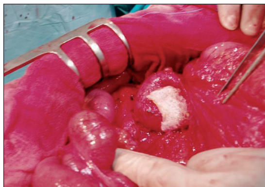
Figura 2: Colocación de una esponja de TachoSil® en el lecho cruento en cabeza pancreática, para intentar sellar la zona y evitar una fístula pancreática.

El tratamiento consiste en la extirpación completa de la lesión, con lo que se consigue un buen