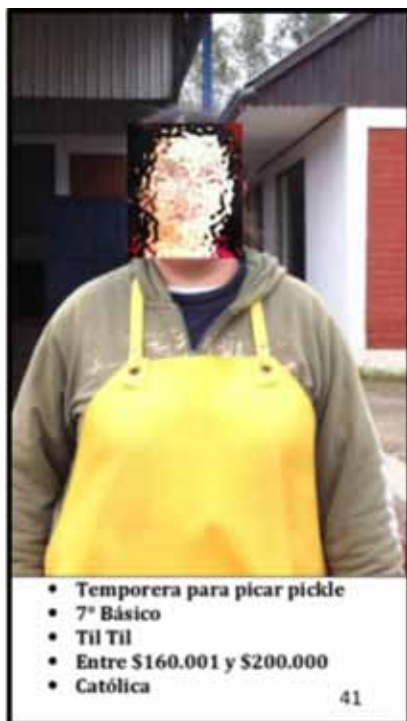
Figura 1. Un ejemplo de naipes utilizados en la investigación

La producción de los datos se realizó a partir de la interacción entre los jugadores siguiendo un protocolo predefinido de modo secuencial, bajo la conducción de una moderadora integrante del equipo de investigadores. La regla principal del juego consistió en agrupar los naipes de común acuerdo, según las características que consideraran más relevantes, según sus propios criterios, evitando así efectos inducidos. Una vez que los jugadores terminaron de agrupar los naipes en distintas pilas, se les solicitó poner un nombre de su elección a cada agrupación. Los juegos fueron videograbados y la clasificación de los naipes fue registrada según pautas preestablecidas.