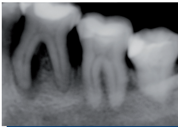
Figura 1. Radiografía inicial.

Al examen radiográfico se detectó una restauración profunda penetrante y una zona radiolúcida que abarcaba desde el periápice hasta aproximadamente el tercio medio de la raíz mesiovestibular (tamaño 8 mm vertical por 3 mm horizontal). Se observaba además pérdida ósea marginal horizontal y vertical por distal del diente, y una cámara y conductos radiculares normales (Figura 1).