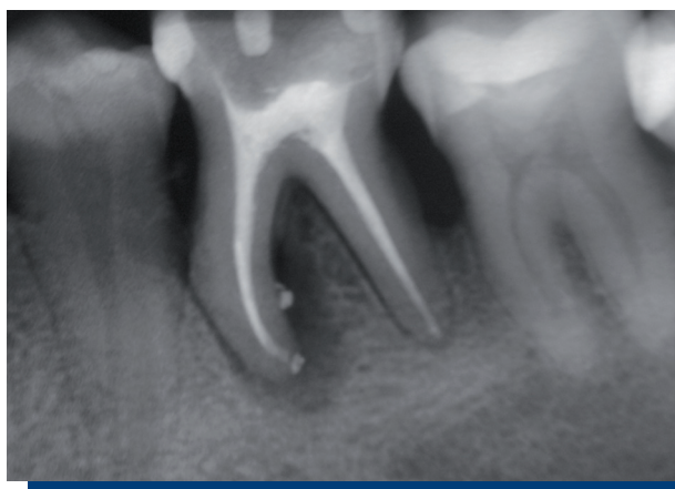
Figura 3. Control de obturación.

Se citó a la paciente una semana después para control clínico y dar el alta. Se derivó nuevamente al periodoncista para que le diese continuidad al tratamiento periodontal. Se citó al paciente para tres meses más para un control clínico radiográfico.