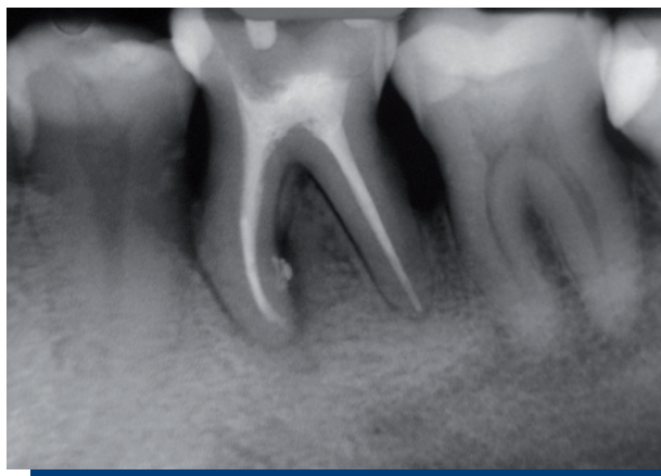
Figura 4. Control a los tres meses.

Al control de los tres meses, clínicamente la paciente se encuentra asintomática y la pieza dentaria ya no presenta movilidad, ni sacos periodontales, ni sangramiento al sondaje periodontal. Radiográficamente se puede observar que la lesión remitió casi en su totalidad, siendo esto una señal de reparación (Figura 4).