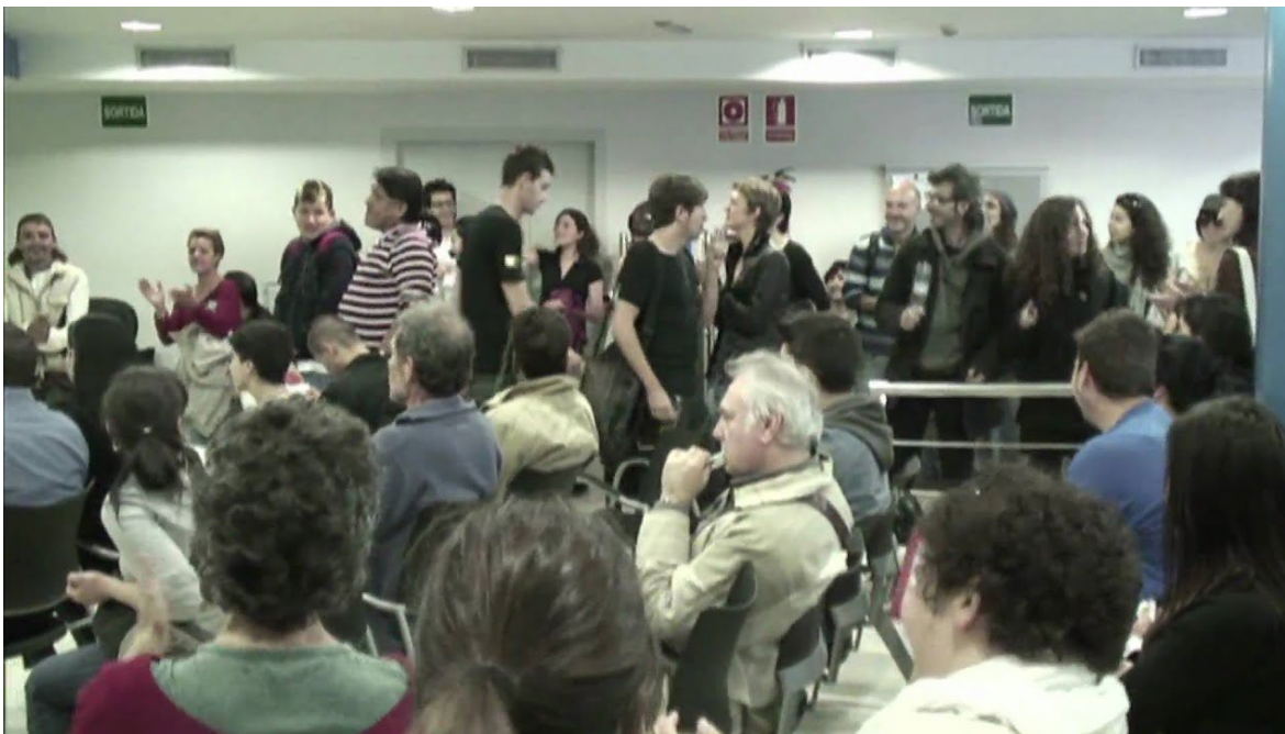
Imagen 2. Comienzo de la intervención en el INEM