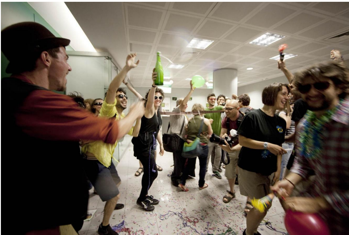
Imagen 5. Comienza la fiesta