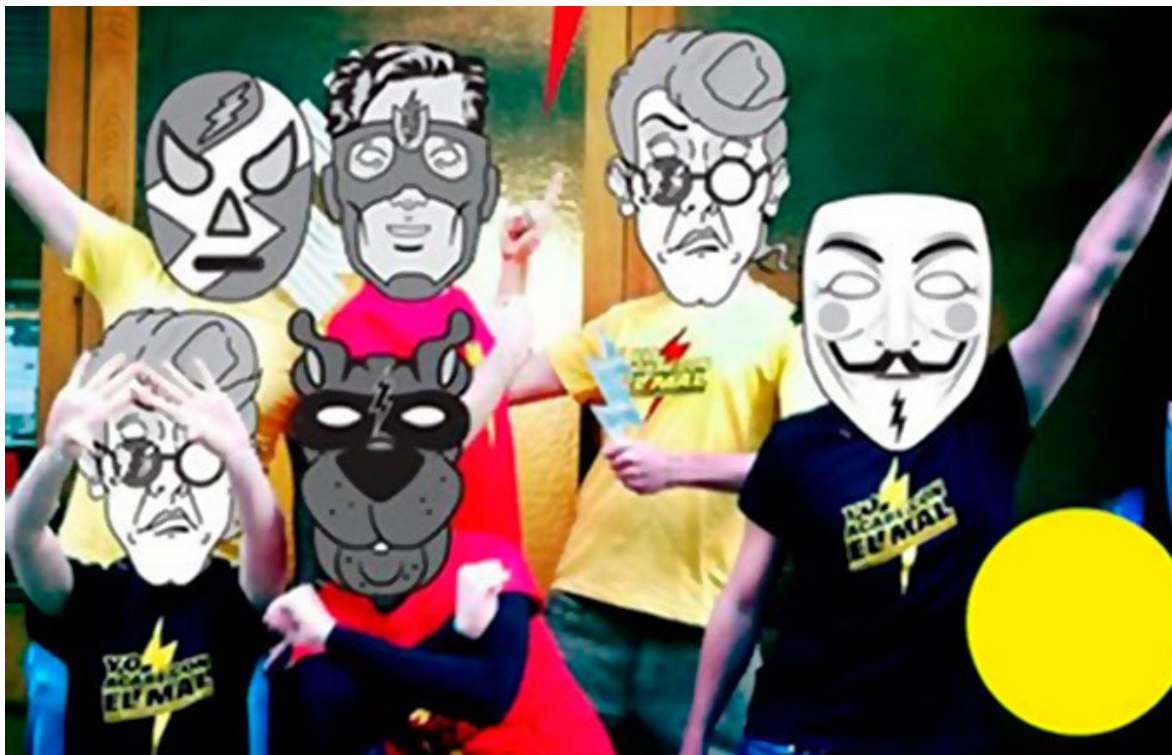
Imagen 1. Presentación del grupo