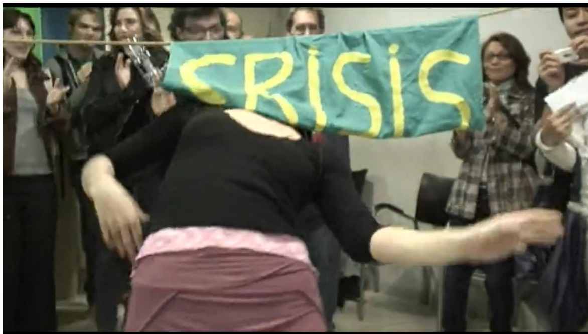
Imagen 3. Limbo a la crisis