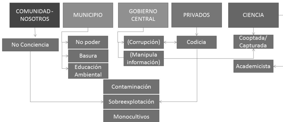
Fig. 2. Actores y narrativas transversales.

Los momentos clave de la gobernanza para el cambio climático pueden ser vistos como los siguientes: (i) comprensión, (ii) planificación y (iii) gestión (Moser & Ekstrom, 2012). Desde este modelo, el primer momento contiene (i) la detección del problema, (ii) la búsqueda y uso del conocimiento/información, y la (iii) (re) definición del problema. Cuando los entrevistados se refieren a su comunidad, en su mayoría pescadores y mitilicultores de Dalcahue, con frecuencia lo hacen desde la narrativa “nos falta conciencia” para actuar frente al cambio climático, lo cual refieren principalmente a brechas en cultura y educación, y especialmente un reclamo por “guía” del municipio. Así, el primer momento de comprensión es donde los entrevistados auto-perciben barreras, asociadas a las distintas etapas de la búsqueda y uso de información, las cuales se verán reflejadas cuando describamos la percepción que tienen de la ciencia. Esta demanda hacia el gobierno local se ha observado para el caso de comunidades rurales, por ejemplo, en el caso de Rumania, donde se espera de él guiar a las comunidades locales, facilitar su construcción de capacidades, catalizar las interacciones entre las organizaciones comunitarias y el sector privado organizado, entre otros (Biriescu & Babaita, 2014).