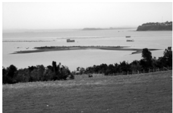
Fig. 4. Izquierda: Saturación de espacio marino por cultivos de mitílicos, canal Coldita, comuna de Quellón (Fotografía: R. Álvarez 2009). Derecha: Banco natural de mariscos afectado por salmonicultura (al fondo), lo que ha causado perjuicios en dos comunidades indígenas ribereñas. Punta Chilen-Coñimó, comuna de Ancud (Fotografía: R. Álvarez 2009).