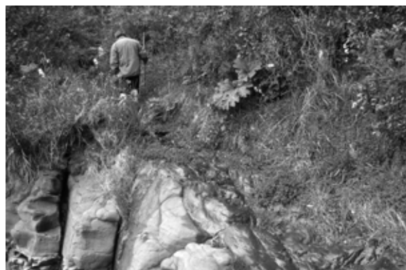
Fig. 2. Izquierda: Sendero de bajamar. Comunidad indígena Tweo de Coldita, comuna de Quellón (Fotografía: R. Álvarez 2009). Derecha: sendero terrestre que comunica tierra-mar (“desecho”), Wentetique, comuna de Ancud (Fotografía: R. Álvarez 2009).