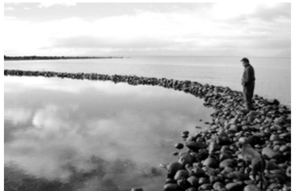
Fig. 3. Izquierda: Varadero de canoas, Coñimó, comuna de Ancud. Derecha: Corral de pesca en isla Caguach, familia Peranchiguay comuna de Quinchao.