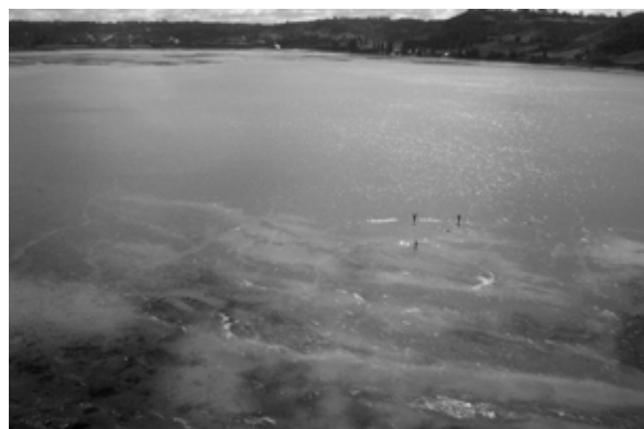
Fig. 5. Dos modalidades en la explotación informal del alga pelillo: Izquierda: Distribución de espacios para siembra y extracción bajo acuerdos locales, Caulín, comuna de Ancud. Derecha: Putemún, comuna de Castro, espacio costero donde conjugan pelilleros de distintas procedencias sin distribución de espacios ni cuotas.