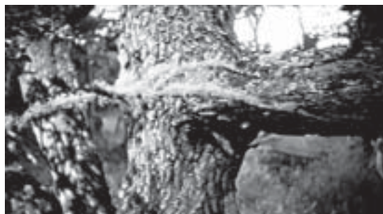
Fig. 6. Fotograma de la película "Yikwa ni Selk'nam".