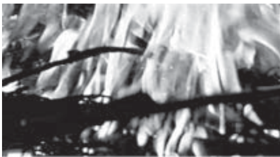
Fig. 5. Fotograma de la película "Yikwa ni Selk'nam".