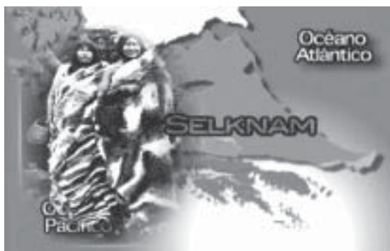
Fig. 8. Fotograma de la película "Estrecho de Magallanes".

grupo cultural a otro sin mayor distinción que la realizada geográficamente al inicio del video (Fig. 8).