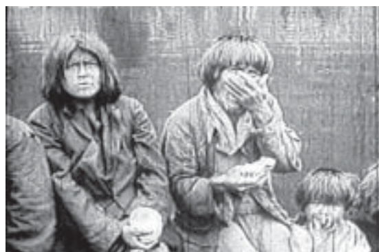
Fig. 1b. Fotograma de la película de Alberto M. De Agostini.

fueguino en el documental chileno se relaciona estrechamente con el fuerte proceso de mortandad sufrida por estas poblaciones indígenas a fines del siglo XIX y comienzos del XX, 7 además de una concepción «realista» del documental que buscaba registrar al indígena concreto, físico, que desaparece ante sus propios ojos. 8