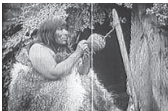
Fig. 4a. Fotograma de la película de Alberto M. De Agostini utilizados en la película "La última huella".