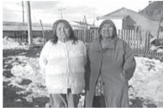
Fig. 3. Fotograma de la película "La última huella".

Otro elemento importante es la presencia