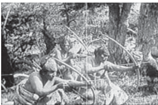
Fig. 1a. Fotograma de la película de Alberto M. De Agostini.