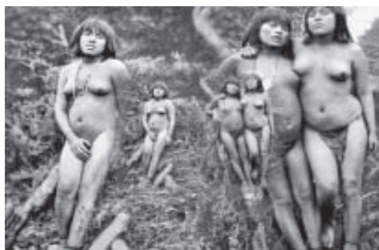
Fig. 9. Fotograma de la película "Estrecho de Magallanes".

En los seis capítulos que construyen el nudo del argumento de esta obra audiovisual se observa un riguroso orden sistemático y métrico, pues muchas de las unidades se repiten en el orden, en sus duraciones, en el tipo de transiciones y en su lógica discursiva. Por ejemplo, todas las secuencias narrativas, a excepción de la presentación (S01) y el epílogo (S09), se inician con un cartel que exhibe el nombre de la secuencia seguida de un texto histórico que sube sobre un fondo constante (el mar visto desde un barco en viaje). Todo esto construye una percepción de uniformidad del relato, la cual el espectador puede anticipar fácilmente sin miedo a equivocarse. Lo que produce una cierta monotonía y aburrimiento por parte de un espectador ávido de quiebres narrativos y audiovisuales.