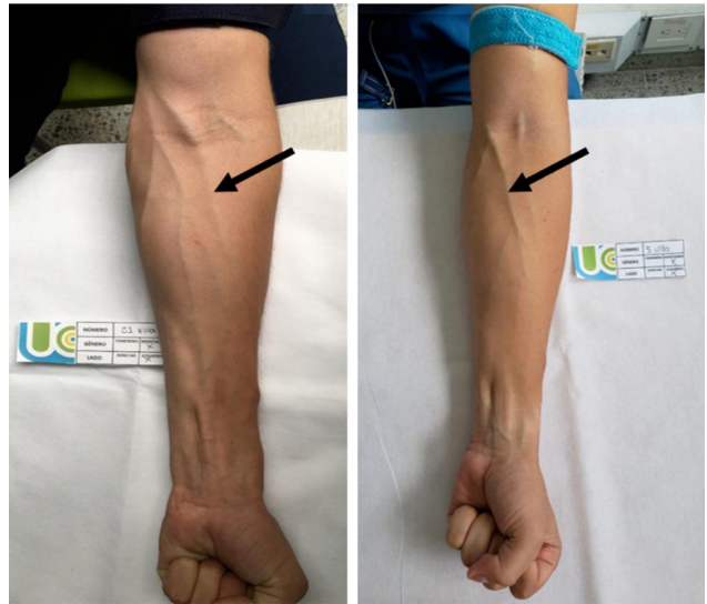
Fig. 2. Venas cefálicas que terminan en la vena basílica.

En el miembro superior derecho se presentó una vena cefálica en 171 casos, (85,5 %), dos venas cefálicas en 27 casos (13,5 %) y tres venas cefálicas en 2 casos (1 %), (Tabla III). En el miembro superior izquierdo se presentó una vena cefálica en 170 casos (85 %), dos venas cefálicas en 26 casos (13 %) y tres venas cefálicas en 4 casos (2 %), (Tabla IV).