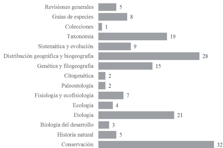
FIGURA 2. Número de publicaciones por área científica durante el periodo 2006-2015. A diferencia de la clasificación por año (Figura 1), aquí se contabilizan algunos capítulos de libros por separado en las áreas respectivas.