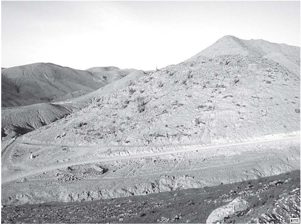
Figura 5. Vista de Jamajuga (Mamiña) en el ámbito de la sierra de Tarapacá.