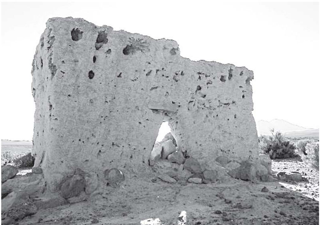
Figura 6. Chullpa del altiplano de Tarapacá (Citani, Isluga).