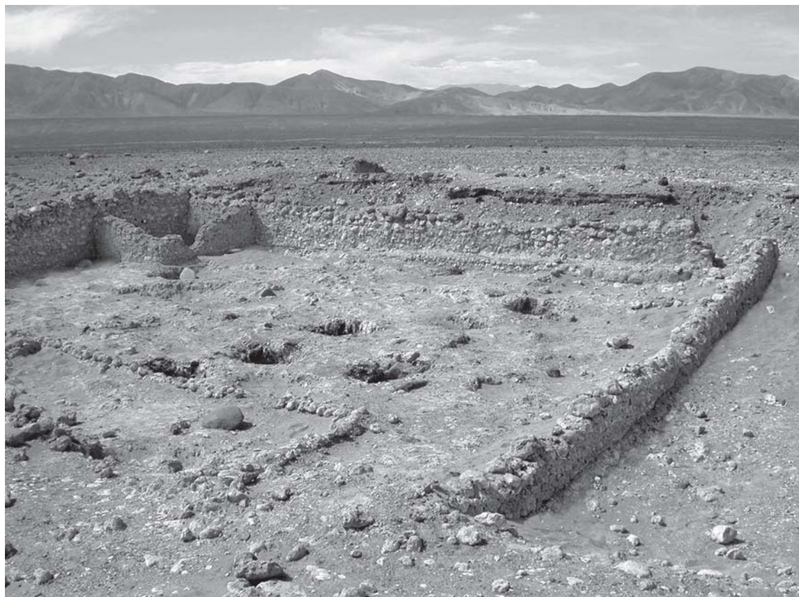
Figura 2. Vista de Caserones-1 en el sector inferior de la quebrada de Tarapacá y Pampa del Tamarugal.

plotación de los recursos del plano inclinado, la Pampa del Tamarugal y la costa (Mostny 1970; Núñez 1981 y 1982; Rivera et al. 1995-96; Adán et al. 2005 Ms). Este sistema del que es heredera y representativa la ocupación tardía de Caserones-1 (Núñez 1966; True et al. 1970) 5 , en la primera mitad del Intermedio Tardío, configura asentamientos “únicos” en términos de su composición arquitectónica con trazado ortogonal, de