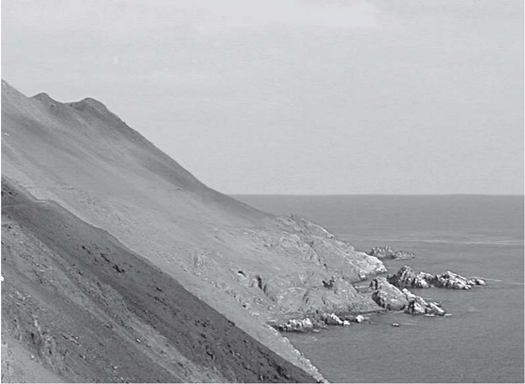
Figura 3. Vista de la costa interfluvial de Tarapacá, donde se emplaza el sitio Pisagua-N.