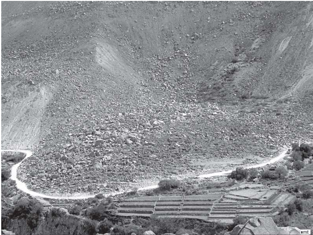
Figura 4. Vista de Camiña-1 en el ámbito de la sierra de Tarapacá.