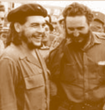
E. Guevara y F. Castro

Instaurada la Revolución de forma oficial el 1 de enero de 1959, el gobierno revolucionario inicia una política de nacionalización de empresas extranjeras y nacionales y se produce un primer acercamiento a la Unión Soviética y a los países del llamado campo socialista. Los Estados Unidos, por su parte, imponen en octubre de 1960 el embargo económico a la isla, un embargo que todavía hoy sigue vigente. En abril de 1961 exiliados cubanos, armados y entrenados por Estados Unidos, realizan un desembarco en Bahía de Cochinos (Playa Girón, Cuba) que es sofocado por el ejército cubano en pocos días. En abril de 1961 Fidel Castro declara el carácter socialista de la Revolución cubana y un año después, el 14 de octubre, se iniciará la llamada Crisis de los Misiles en Cuba cuando un avión de reconocimiento norteamericano descubre la construcción de emplazamientos para misiles nucleares en Pinar del Río. La crisis finalizará el 27 de octubre con el compromiso soviético