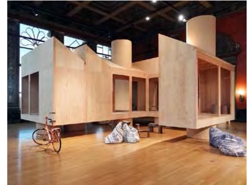
House No. 11 (Corridor House), MOS Architects.