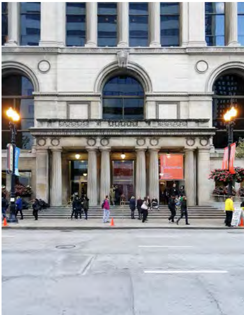
Chicago Cultural Center, Chicago, EE.UU.