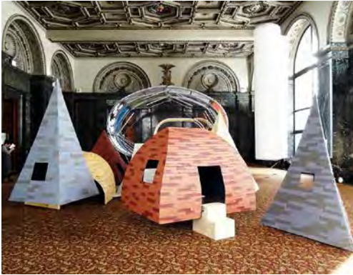
Children's Town , Maki Onishi + Yuki Hyakuda.