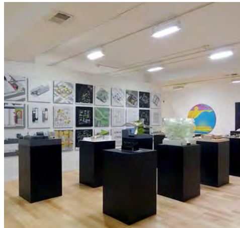
Exposición Bold: Alternative Scenarios for Chicago