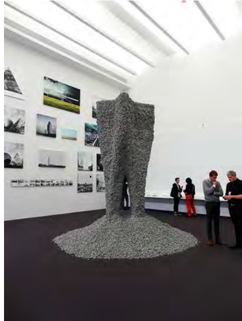
En primer plano: Rock Print , por Gramazio Kohles Research, ETH Zürich + Self-Assembly Lab, MIT. En el muro Narrative Architecture: A Manifesto , por WA1 Architecture Think Tank.