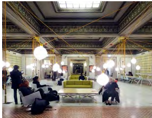
Randolph, intervención de Pedro&Juana.