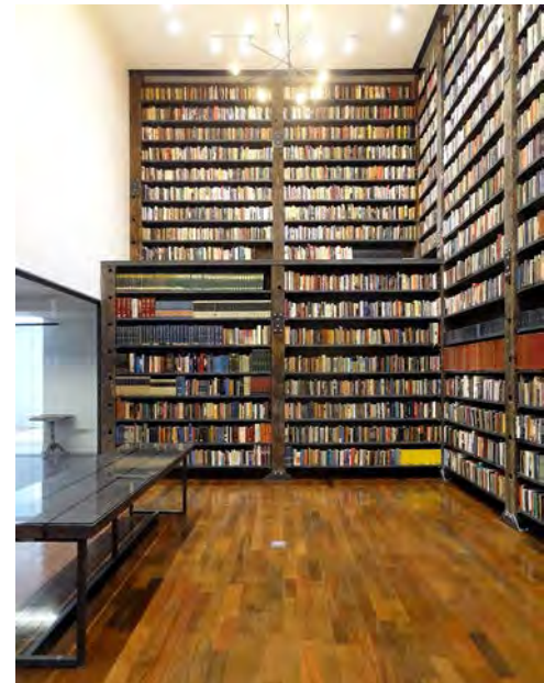
Biblioteca del Stony Island Arts Bank

y actividades abiertas para la comunidad, haciendo referencia a los procesos de abandono de las ciudades y la reconstrucción de identidad como resistencia. Quizás esta es una de las lecciones que deberían tomar otras bienales; asumir este tipo de instancias como una oportunidad de activar nuevos espacios y celebrar la arquitectura, en vez de una circulación de figuras que, en muchos casos, se mueven como mercancías culturales.