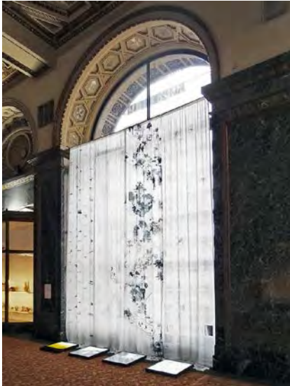
Islands, Atolls, and Other Derivative Territories , LCLA Office © Sebastián Paredes