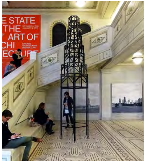
Maqueta e imágenes de Cent Pavilion, Pezo von Ellrichshausen.