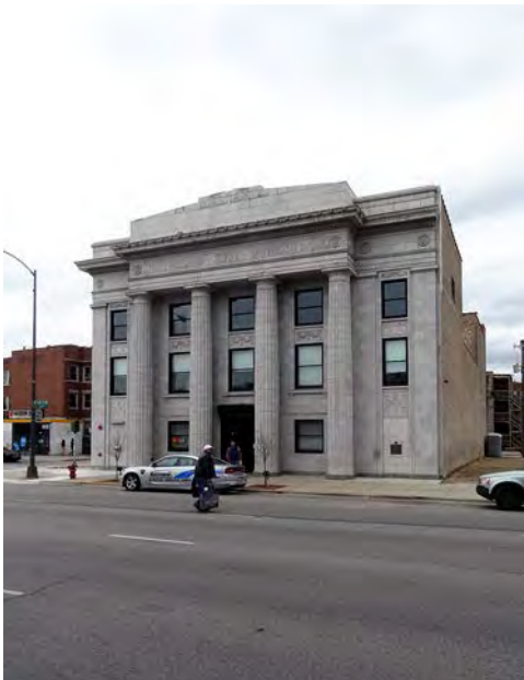
Stony Island Arts Bank, Chicago, EE.UU.