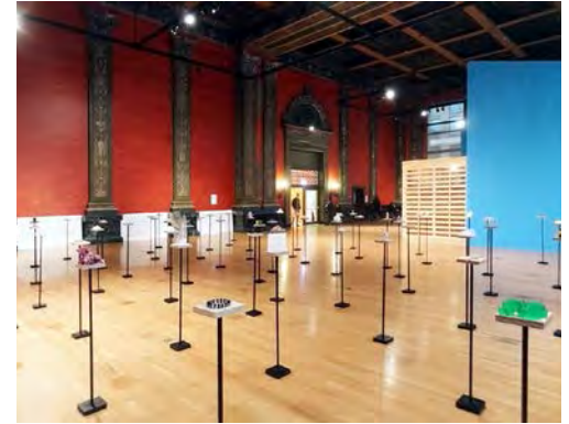
Architecture is Everywhere , Sou Fujimoto.