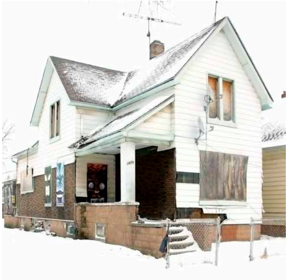
Condiciones previas, vista desde la calle / Previous conditions, view from the street