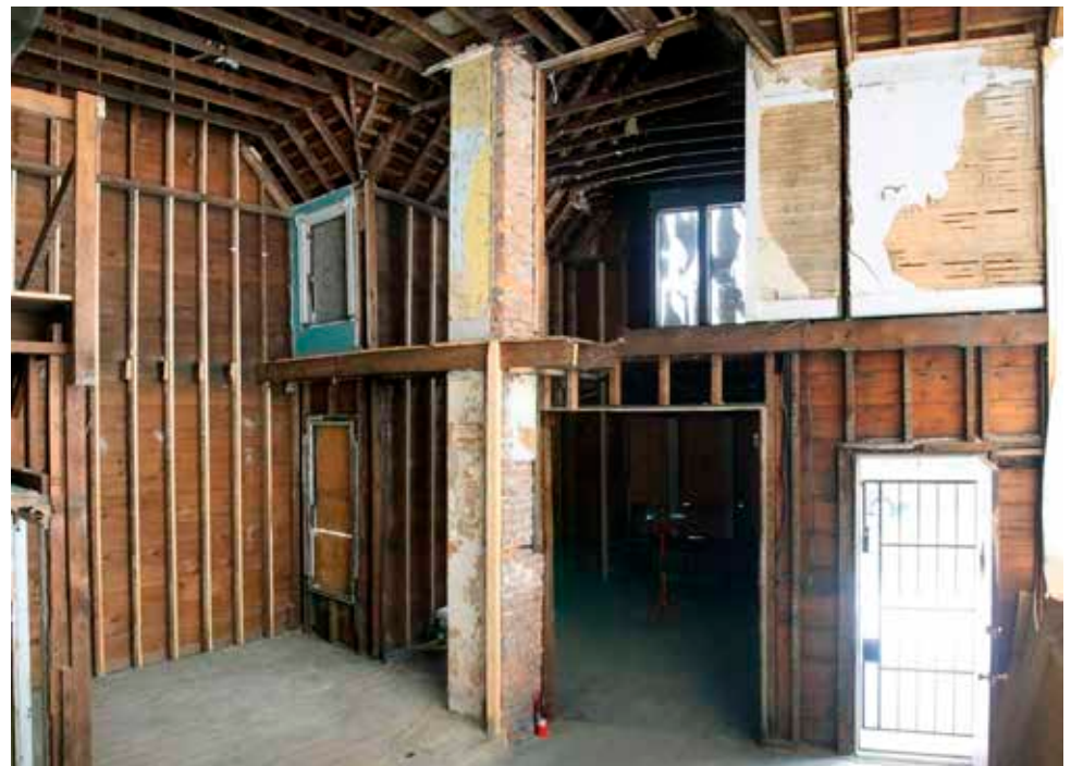
Escenario interior / Interior stage

Arquitecto, Master en Prácticas Críticas, Curatoriales y Conceptuales en Arquitectura, Universidad de Columbia GSAPP (EE.UU., 2013). Licenciado en Arquitectura de la Universidad Politécnica de Puerto Rico, 2004. Fue investigador y coordinador de producción de la exposición House Housing: An Untimely History of Architecture and Real Estate que el Buell Center de la Universidad de Columbia exhibió en Venecia en 2014. Co-editor el libro Promiscuous Encounters de GSAPP Books, editor y fundador de Polimorfo y director de CIUDADLAB. Recientemente ha sido seleccionado para representar a los EE.UU. en el Pabellón en la Bienal de Arquitectura de Venecia (2016). Es profesor asistente adjunto en el Barnard College de Arquitectura de la Universidad de Columbia, y docente en el Instituto Tecnológico de Nueva Jersey.