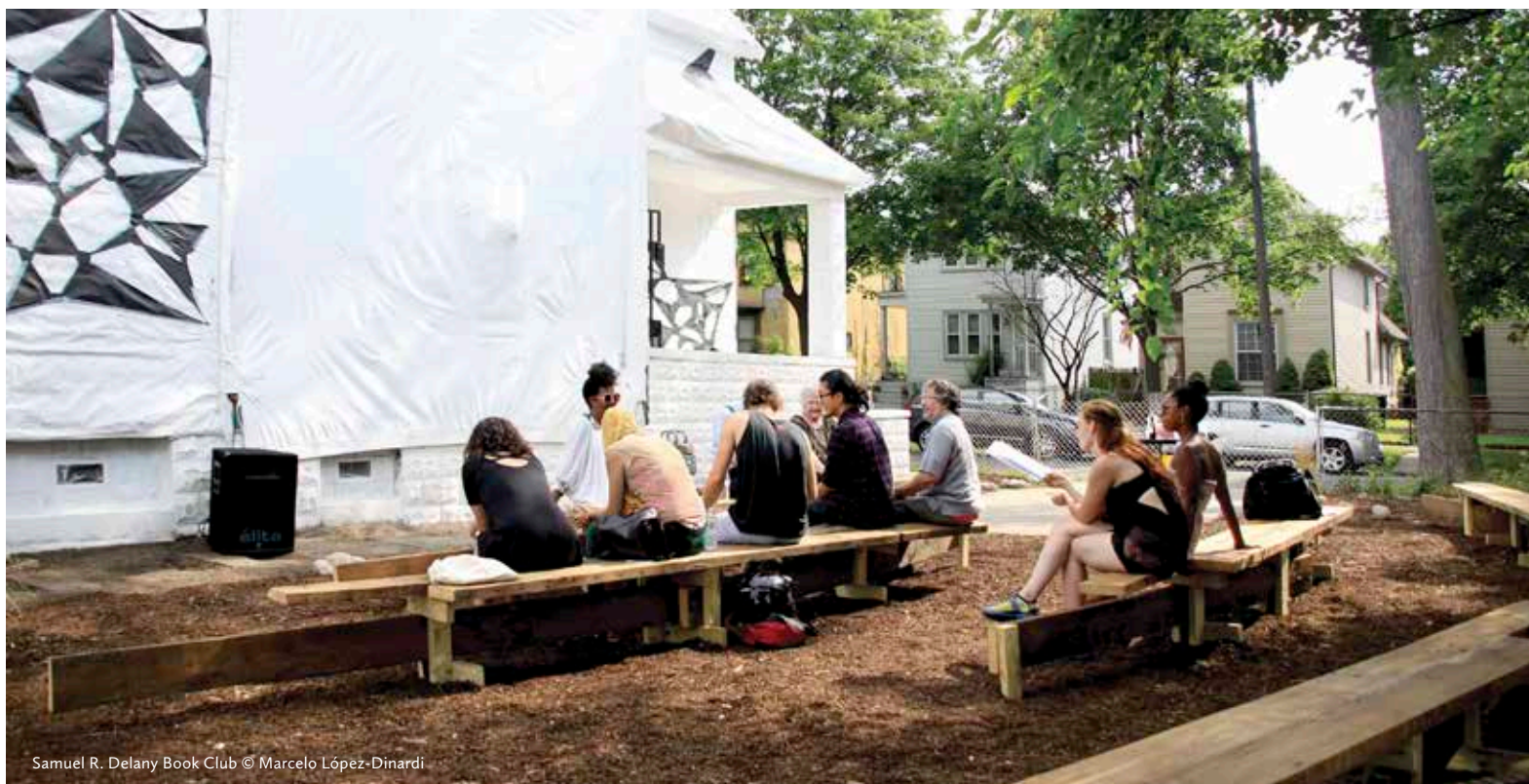
Samuel R. Delany Book Club © Marcelo López-Dinardi