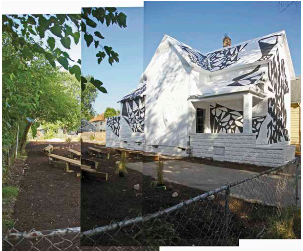
Vista exterior / Exterior view