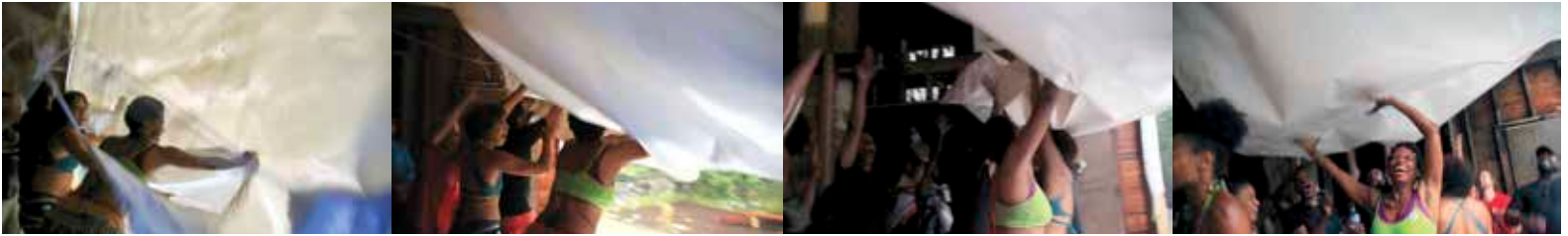
Cortina desplegándose hacia el exterior / Curtain folded-out to the exterior