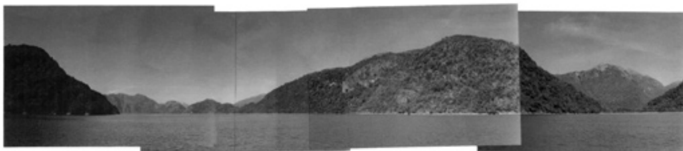
Fiordo Aisén. Fotomontaje paseo Bahía Candelaria - Pta. Canal