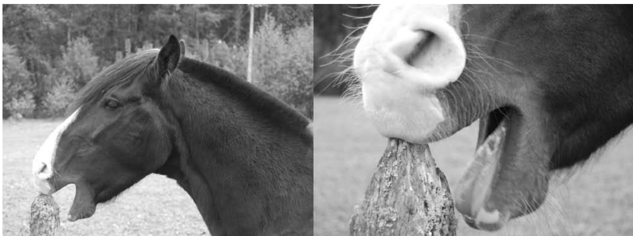
Figura 3. Fotografía de equino realizando la conducta estereotipada de aerofagia sobre un cerco.

La aerofagia se ha relacionado también con una serie de problemas gastrointestinales (Nicol y col 2002), pudiendo tratarse más bien de una manifestación o consecuencia de éstos más que de una causal adicional, ya que podría ser una conducta que genera una sensación placentera a un animal que sufre de malestar gastrointestinal (Haupt 1986). Esta sensación de placer estaría dada, por ejemplo, por la aerofagia como un potencial medio de producción de saliva para contrarrestar el efecto de acidificación a nivel estomacal e intestino grueso, producto de dietas muy ricas en almidón (Nicol y col 2002, Hemmings y col 2007). Es importante recordar que los equinos sólo producen saliva como respuesta a la masticación, y no como respuesta anticipada a la alimentación. La cantidad de saliva producida va a depender del contenido de agua,