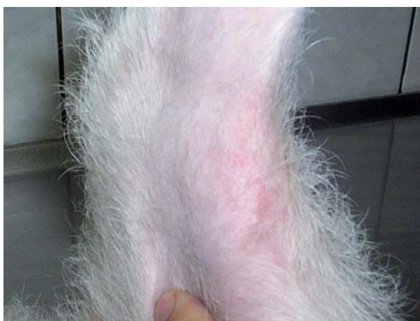
Figura 1. Cara interior del muslo que muestra lesión seborreica, pelaje opaco y áreas de alopecia hiperpigmentadas e hiperqueratinocíticas con borde eritematoso.

Al examen dermatológico, se evidencia pelaje opaco, seborreico, de fácil depilación a la tracción, con una rarefacción pilosa generalizada, áreas de alopecia hiperpigmentadas e hiperqueratinocíticas con borde eritematoso, circunscritas en la cara interior-caudal de ambos muslos (figura 1). Además, se observan ambos conductos auditivos externos eritematosos, con pápulas e hipertriosis y furunculosis perianal. La paciente presentó prurito en más de cinco ocasiones durante la consulta, manifestando lamido abdominal, interdigital y perianal, así como rasquido de la cabeza con las garras de las extremidades posteriores.