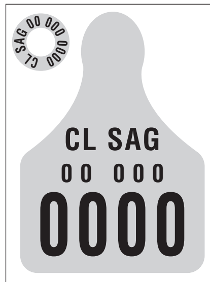
Figura 1. Modelo de dispositivo de identificación oficial (DIIO) implementado en Chile.

Métodos de identificación electrónica (IDE). La necesidad de disponer de métodos de identificación animal que faciliten la trazabilidad de sus productos y que puedan ser usados globalmente despertó el interés por la identificación electrónica (IDE) mediante dispositivos pasivos de radiofrecuencia que utilizan radiaciones electromagnéticas no ionizantes. Estos sistemas están constituidos por dispositivos electrónicos pasivos de pequeño tamaño llamados transponders (figura 2 A) que son sondea-