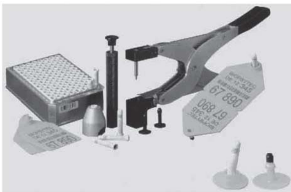
Figura 4. Sistema Biopsytec de identificación y trazabilidad animal.

Biopsytec system for animal ID and traceability.