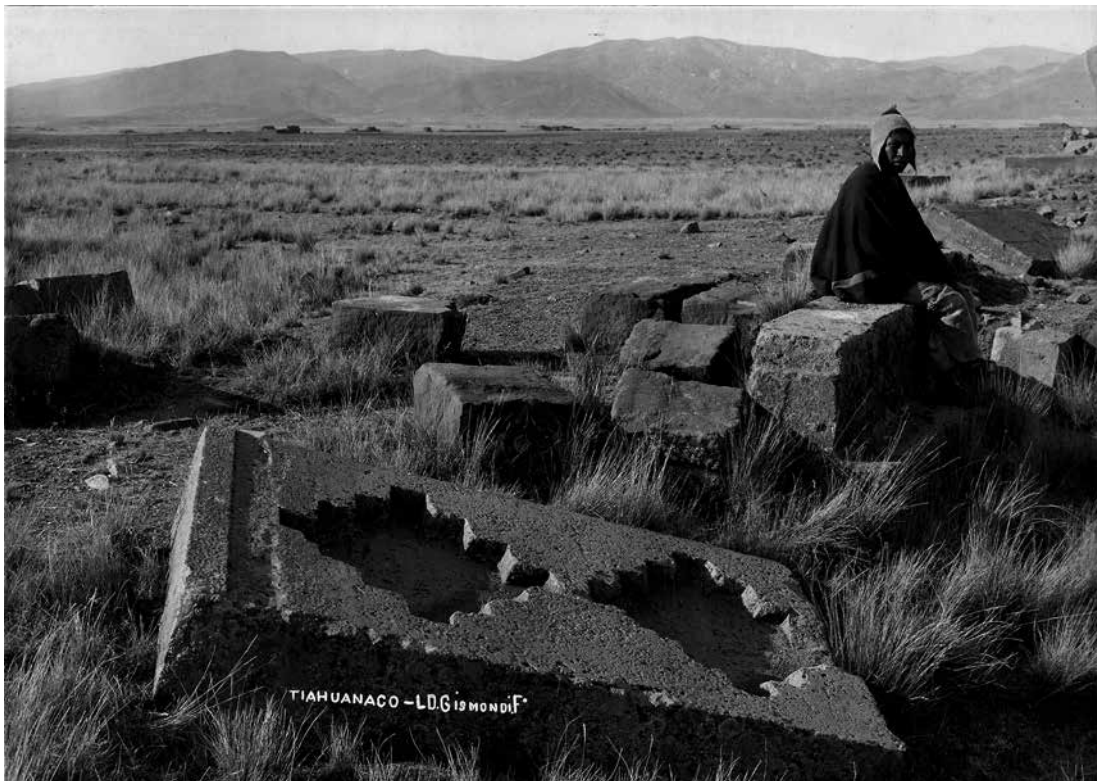
Figura 3. L.D. Gismondi. Tiahuanaco (Piedras de Queri-Cala). Hacia 1907. Positivo original. Gelatina-plata y papel, 20 x 25 cm. Colección Diran Sirinian. Buenos Aires. Argentina.