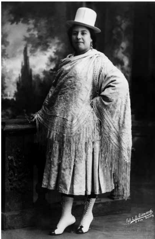
Figura 1. L.D. Gismondi. Chola paceña, gran dama . Hacia 1920. Archivo Estudio Gismondi. La Paz. Bolivia.

Vargas, J.N. Piérola, los hermanos Kavlin y otros, realizadas tanto en La Paz como en Oruro, Potosí, Cochabamba, Sucre y Tarija. Estos retratos son testimonio de la alta autoestima de estas mujeres de la clase social emergente en el país, y de cómo ellas los usaron como instrumento de legitimación social y nivelación con las elites urbanas; así como, y por otra parte, del intenso uso comercial que los fotógrafos hicieron del tema como personajes típicos de La Paz y otras ciudades (Querejazu 2015, M. T. Vargas).