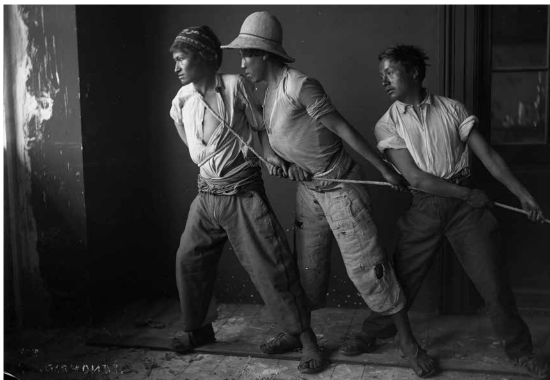
Figura 6. L.D. Gismondi. Hombres tirando una cuerda . Hacia 1925. Archivo Estudio Gismondi. La Paz, Bolivia.

Gismondi tenía una mirada inquieta y descubridora con la que transitó constantemente por las fronteras naturales –geográficas- y las simbólicas –mentales-, que caracterizan y definen a los países y sus regiones. También transitó sin solución de continuidad por los límites y fronteras culturales, raciales, sociales y económicas de la pirámide social; retrató a las elites pudientes, pero también legitimó a los componentes de las clases emergentes y dio voz e imagen a los indígenas originarios de varias partes del país y la región, e individualizó y valoró a los sectores sociales marginados, que las elites económicas y sociales ignoraban y excluían.