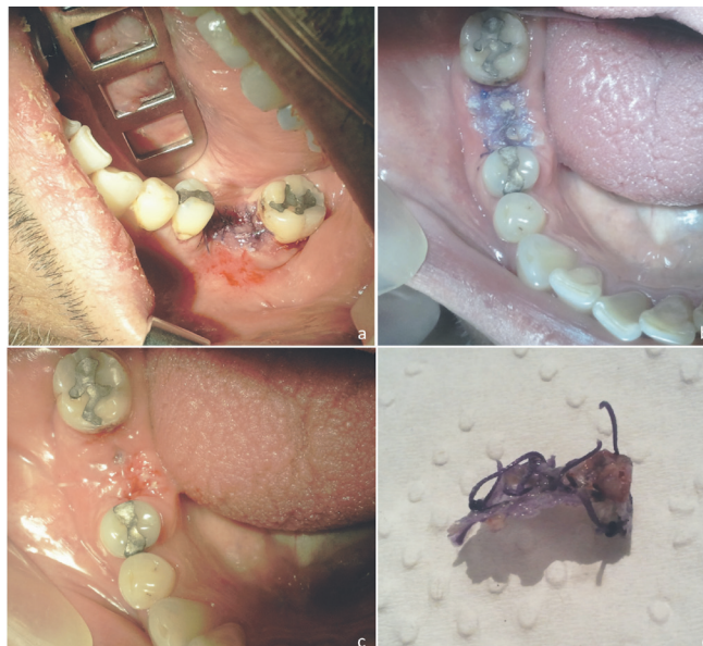
Figura 1. (a) Aplicación de adhesivo de cianoacrilato (Histoacryl®) en el intraoperatorio, sobre sutura de exodoncia compleja. (b) Control postoperatorio a los 10 días, (c) herida operatoria luego de retiro de sutura y material adhesivo, (d) ACA retirado de la herida operatoria.

Los ACA son un material con índice de irritación oral mínimo (31) . Se ha descrito clínicamente mayor dolor y edema local asociados a las suturas en los tres primeros días postoperatorios (21) y mayor inflamación e infiltrado de células inflamatorias cuando son comparadas con los ACA en heridas intraorales (16,32) . Por otro lado, los ACA estarían asociados a una mayor aparición de fibroblastos jóvenes, un menor tiempo de cicatrización y generarían una mejor epitelización (8,21) . (Figura 1)