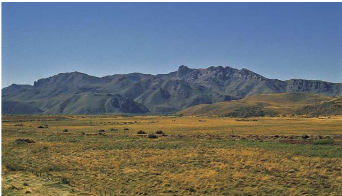
Figura 6. Ambiente de estepa, en cercanías de Leleque, al este de Cholila. Figure 6. Steppe environment, near Leleque, east of Cholila.