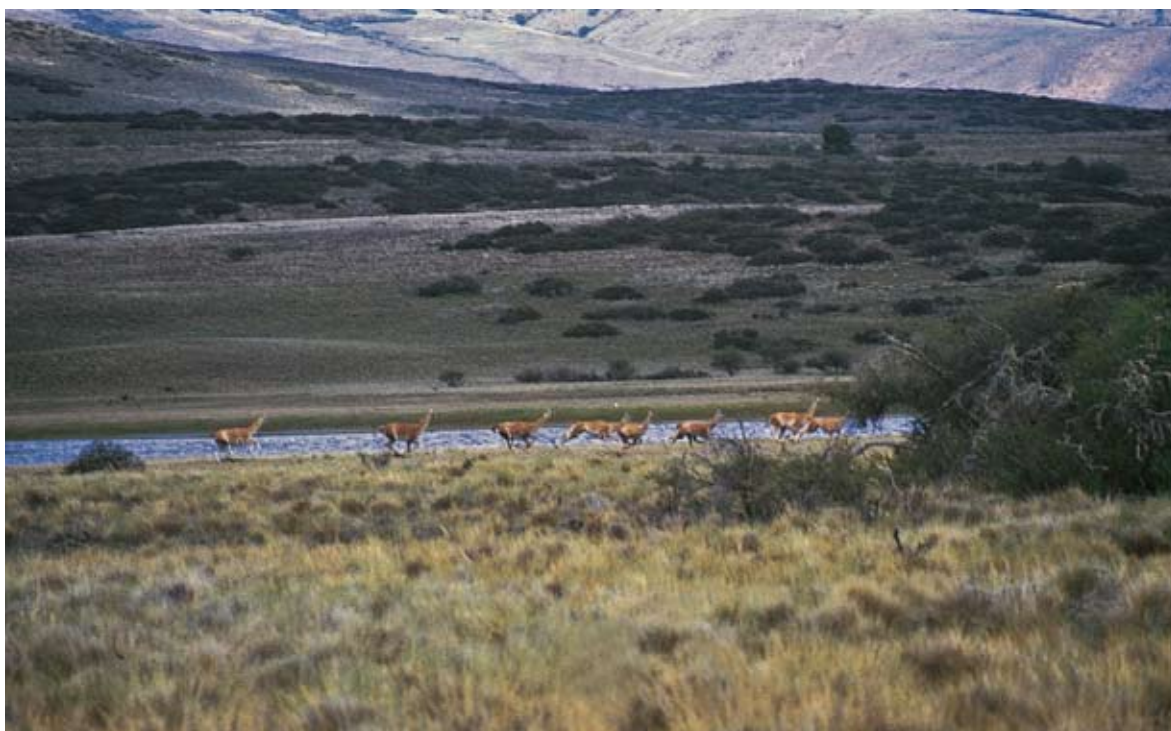
Figura 5. Ambiente ecotonal entre bosque y estepa. Laguna El Cóndor, entre Cholila y Leleque. Figure 5. Forest-steppe ecotonal environment. El Cóndor Lagoon, between Cholila and Leleque.