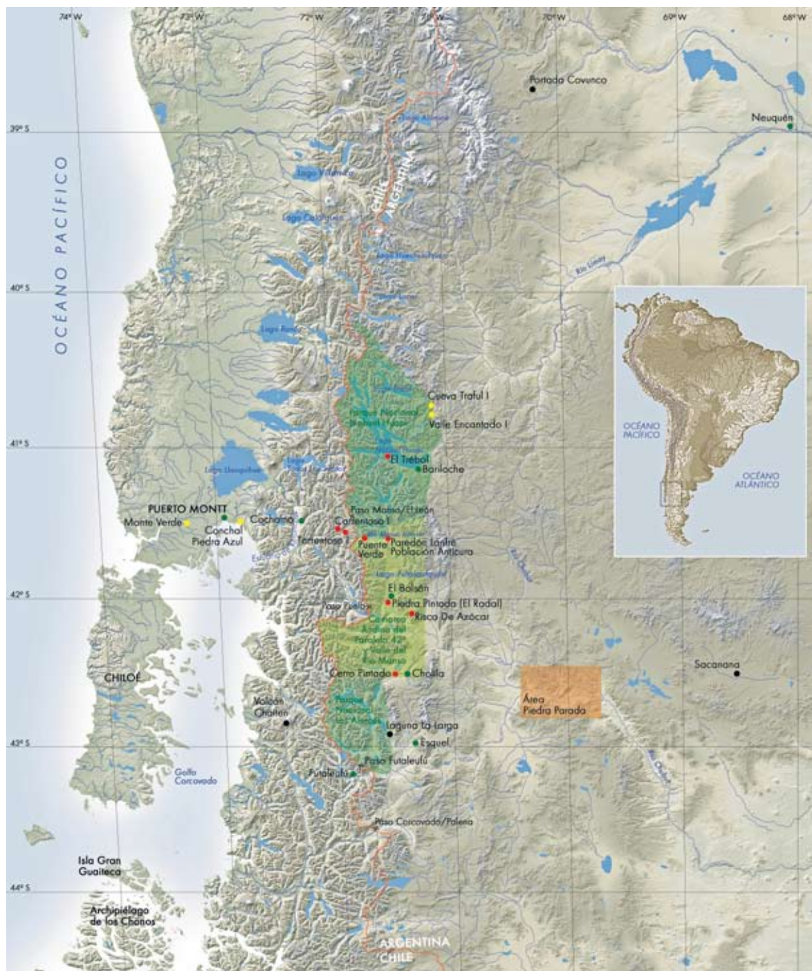
Figura 1. Ubicación de los pasos cordilleranos entre las latitudes de 41° 30' y 43° 40' sur, con la localización de la Comarca Andina del Paralelo 42° y valle del río Manso inferior, los sitios mencionados (punto amarillo: sin arte rupestre; punto rojo: con arte rupestre) y fuentes de obsidiana (punto negro).