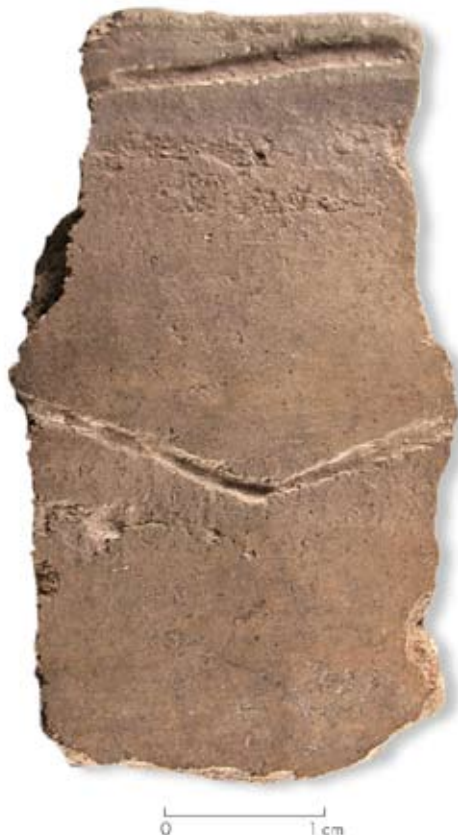
Figura 15. Tiesto del sitio Población Anticura (valle del río Manso inferior).

Figure 14. Decorated bone fragment from Paredón Lanfré (Manso River Valley).