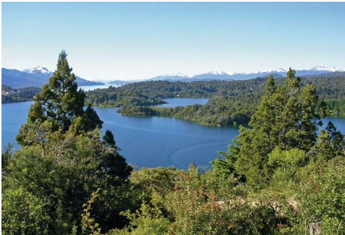
Figura 4. Ambiente de bosque caducifolio en el Parque Nacional Nahuel Huapi. Figure 4. Deciduous forest in Nahuel Huapi National Park.