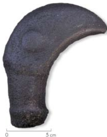
Figura 12. “Toki” hallado cerca de la frontera de Chile y Argentina, valle del Río Manso.

En cuanto a los tokis , un poblador halló en la zona fronteriza del valle del río Manso inferior la pieza que ilustramos en la figura 12. Además, en el otro extremo del valle nos informaron de un hallazgo similar (Huenchupán, comunicación personal).