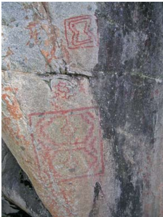
Figura 8. Arte rupestre del Estilo de Greca o Tendencia Abstracta Geométrica Compleja. Paredón Lanfré, valle del río Manso inferior.

Figure 8. Greca Style, or Complex Abstract Geometric Tendency, rock art. Paredón Lanfré, lower Manso River Valley.