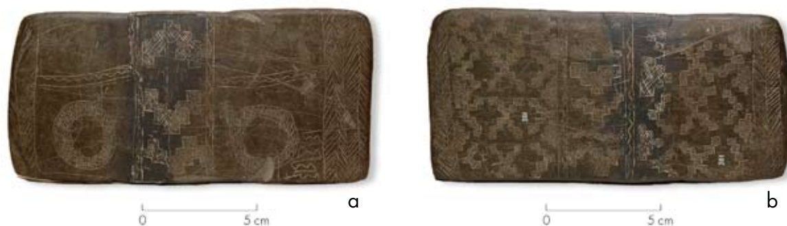
Figuras 11a y b. Anverso y reverso de la placa de Epuyén. La foto muestra que fue reparada en el centro, ya que en la ilustración publicada originalmente por Greslebin (1930) este sector falta.

Figures 11a and b. Face and reverse side of the Epuyén Plaque. The photograph shows that the center of the piece was repaired, since in a drawing published earlier by Greslebin (1930), this part was missing.