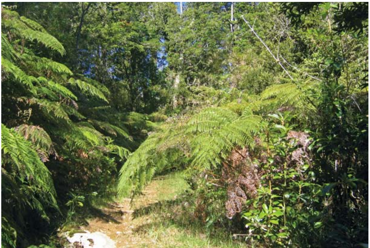
Figura 3. Ambiente de selva valdiviana. Parque Oncol, cerca de la ciudad de Valdivia.

Figure 2. Sectional diagram of the mountain elevations along the 43° South Latitude (from Tortorelli 1947: 57).