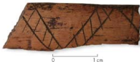
Figura 14. Fragmento de hueso decorado de Paredón Lanfré (valle del río Manso inferior).

Figure 13. Incised plaque fragment from the Cerro Pintado site (Cholila).