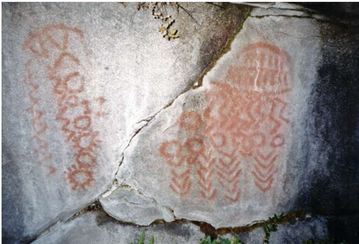
Figura 10. Sitio con arte rupestre en el valle del río Correntoso, afluente del Manso, en sector chileno.

Figure 10. Rock art site in the valley of the Correntoso River—tributary of the Manso River— situated in Chile.