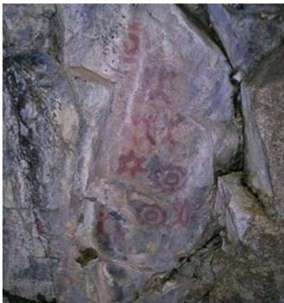
Figura 9. Arte rupestre de la Modalidad del Ámbito Lacustre Boscoso del Noroeste de Patagonia. Alero Pataguas, valle del río Epuyén (detalle).

Figure 8. Greca Style, or Complex Abstract Geometric Tendency, rock art. Paredón Lanfré, lower Manso River Valley.