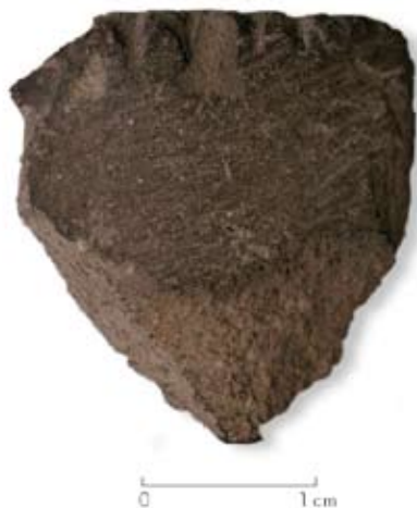
Figura 13. Fragmento de placa con incisiones del sitio Cerro Pintado (Cholila).

Figure 13. Incised plaque fragment from the Cerro Pintado site (Cholila).