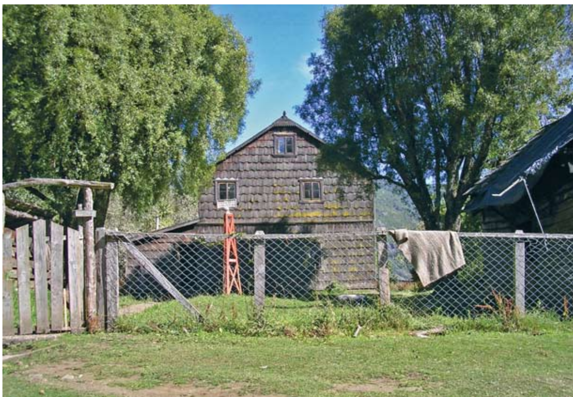
Figura 7. Hito límite en el paso del Manso o El León, ubicado en el interior de una vivienda. Figure 7. Border marker in a home lot, in El Manso or El León Pass.